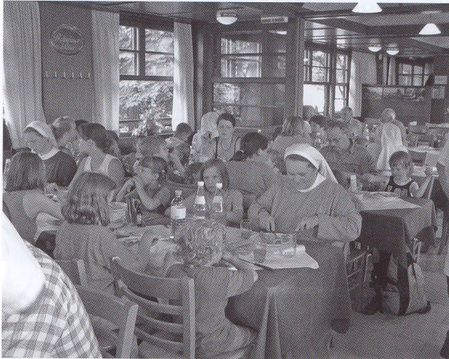
Man sieht's die Jause schmeckt.

Nach den Anstrengungen des Tages gab es für die großen und kleinen Gäste, sowie in den vergangenen Jahren auch, eine von der Familie Kolarik vorbereitete Jause im Schweizerhaus. Den Abschluss bildete noch eine Fahrt mit der Hochschaubahn. Nur mit Mühe waren die Kinder zu bewegen, zu den wartenden Taxis zu gehen. Zu schön war dieser Tag für sie.