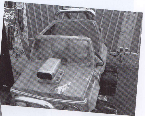
... früh übt sich ...