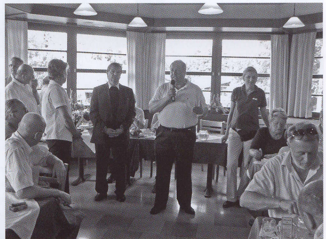
Die Jause ist eröffnet...