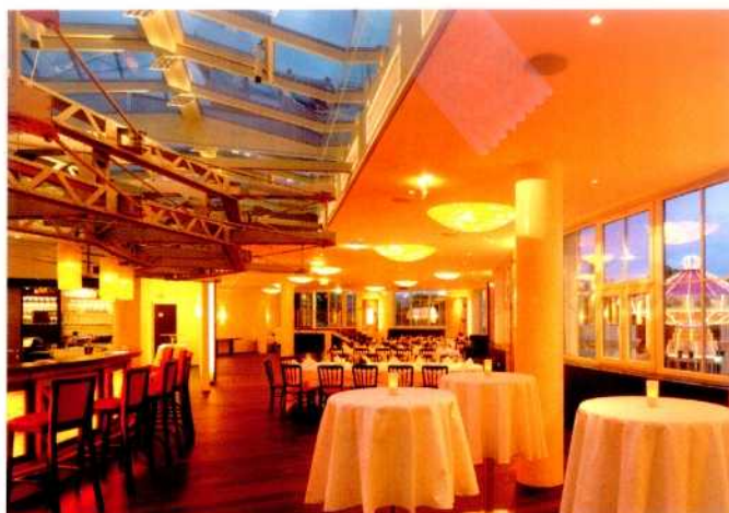
Einladende Atmosphäre in der Event-Location ‚Waggon 31‘