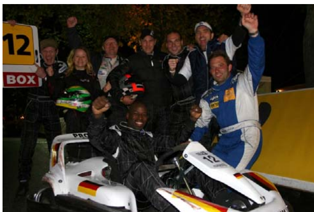
Verkratzt aber heil brachte das deutsche Promi Team ihr Kart mit der Nr. 12 ins Ziel

Zuerst gab es ein 10 minütiges Qualifying und gleich danach ein 20 minütiges Sprintrennen über Stock und Stein durch den Prater. Walter und ich, im "7 7 7 Team", verpassten mit unserem knallroten-Filtzer ganz knapp den Sprung aufs Podium. Aber trotzdem hatte ich riesigen Spass, mich mit den Promis zu messen.