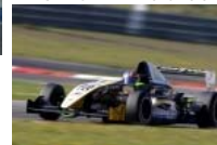
Eurocup Formel Renault 2.0: Jenzer Motorsport mit einer harten Zeit am Nürburgring