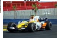
Nelson Piquet Kolumne im August - Debut der Formel 1 in Valencia