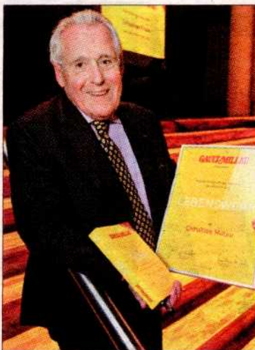
„Gault Millau“-Gründer Christian Millau

deftiges Gulasch oder ein ordentliches Schnitzel wie in den 60ern gibt.“ Delikat!