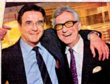
Hans Mahr zusammen mit Heinz Marecek