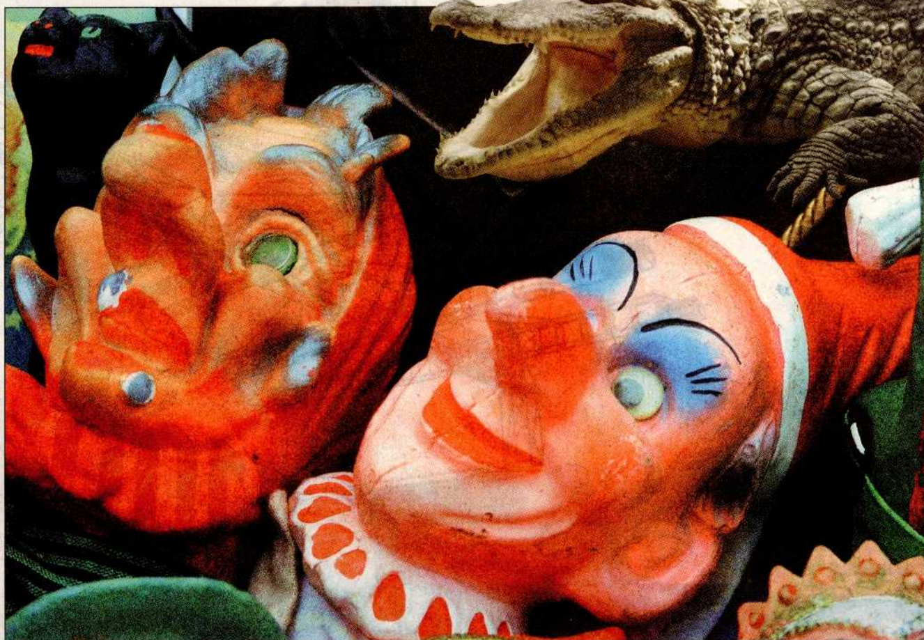
Ob aus England, Italien, Ungarn oder Österreich – die bunten Gesellen kämpfen überall tapfer gegen große Krokodile

Bei den 30-Jahr-Feierlichkeiten in der Arena wird auch auf Kinder nicht vergessen. Dosenwerfen, Luftburg, Kinderschminken, Plantschbecken und Wasserspiele, Kinderfilme, Gesellschaftsspiele und vieles mehr werden heute dafür sorgen, dass auch in Zukunft das Publikum nicht ausgeht. Um auch die Eltern etwas zu entlasten, stellt das Arena-Team durch Kindergruppen-Betreuer und geschultes Barpersonal sicher, dass der Spaß nicht nur den jungen Besuchern vorbehalten bleibt.