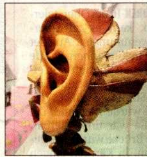
Ohren auf in der Albertina