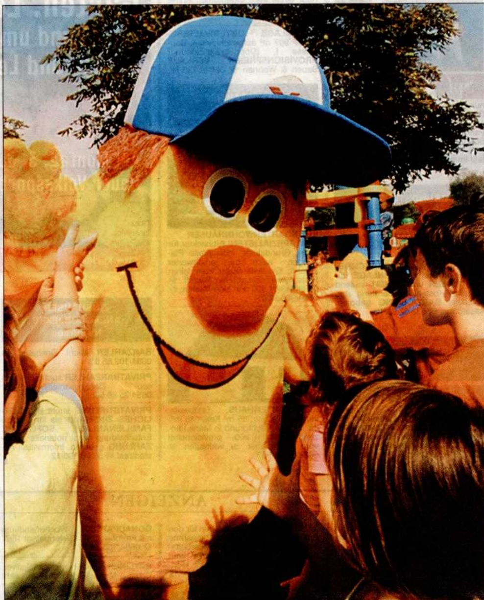
Auf der Kaiserwiese feiern Kinder den Beginn der Ferien mit einem bunten Programm