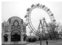
Kostenexplosion: Bauten vor Riesenrad sollen 60 Millionen gekostet haben.