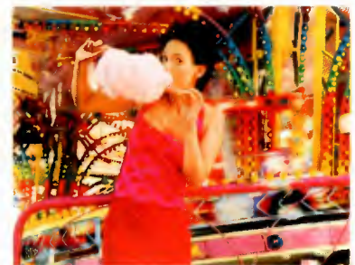
Zuckersüßes im Wurstelprater

In lauschigen Schanigärten sitzen, auf den Enzis im Museumsquartier lümmeln, einen Cocktail am City-Beach schlürfen, auf der Donauinsel flanieren oder die vielen Freibäder stürmen: Sommer in Wien, das bedeutet Lebenslust und Urlaubsgefühl an jedem Tag. Das findet auch das Beratungsunternehmen Mercer, das Wien heuer erstmals als die Stadt mit der höchsten Lebensqualität weltweit ausgezeichnet hat. Damit hat Wien den Vorjahressieger Zürich überholt. Wenn die Hitze über den Asphalt flirrt, sorgen nicht nur die vielen Gewässer Wiens für Abkühlung: Wälder, Wiesen, Parks und Gartenanlagen, die mit 20.200 Hektar rund die Hälfte der Stadtfläche ausmachen, bieten ein schattiges Refugium. Die grüne Lunge der Donaumetropole ist der über sechs Millionen Quadratmeter große Prater. Ein wunderbarer Ort für faule heiße Tage. Allein die Prater Hauptallee ist fünf Kilometer lang und wird zu jeder Tageszeit von Joggern genutzt. Turbulenter geht's im benachbarten Wurstelprater zu – mit Riesenrad, Geisterbahnen und hochmodernen Achterbahnen. Der Weg ans Wasser oder ins Grüne lässt sich per Leihrad zurücklegen: Mehr als 1.000 Citybikes und 60 Bikestationen stehen zur Verfügung. Skater flitzen nicht nur auf der Donauinsel, sondern jeden Freitag ab 22