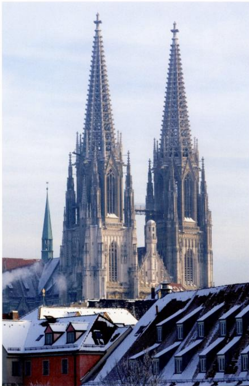
Viel Tradition und Kultur, aber auch Möglichkeiten zum Feiern erwarten den Gast zu Silvester im bayrischen Regensburg.