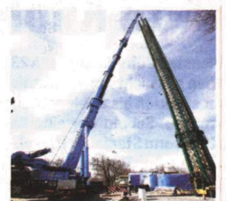
Beim Aufbau vor einer Woche.

Anfragen für weitere Nutzungsrechte an den Verlag