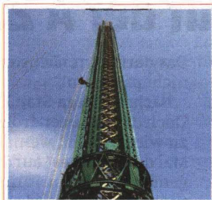
Betriebsbereit in einem Monat.