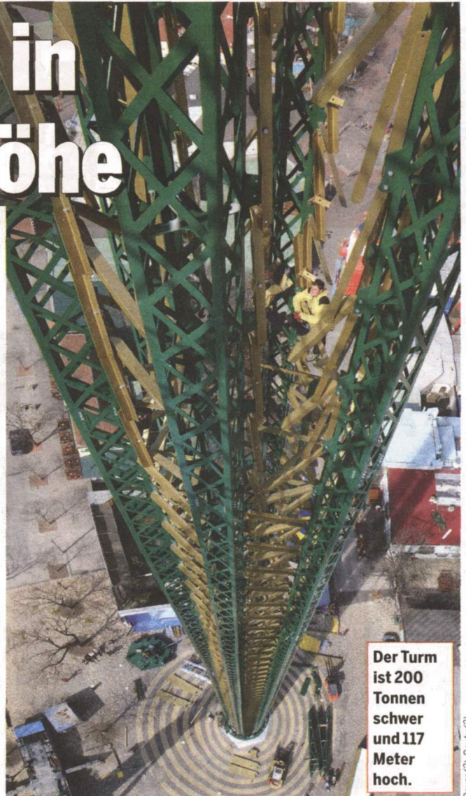
Der Turm ist 200 Tonnen schwer und 117 Meter hoch.