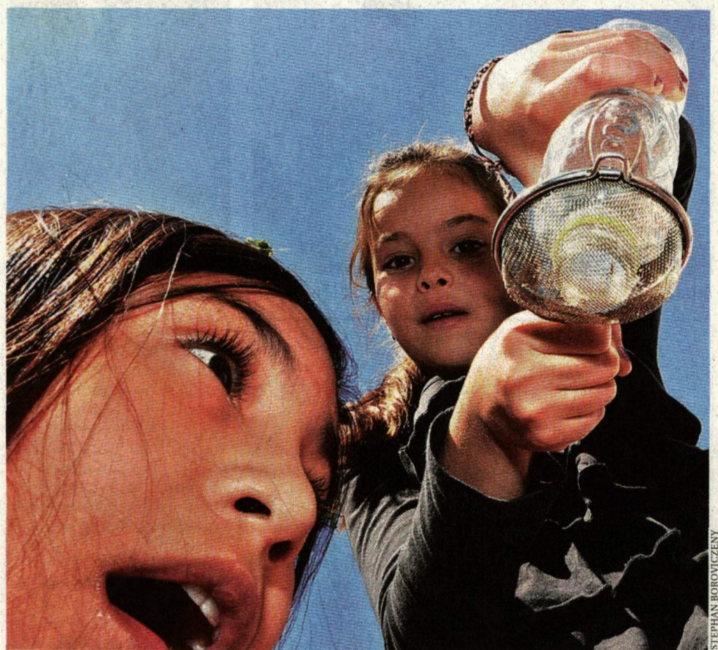
Physik und keine Zauberei: Die Flasche direkt aufs Sieb gepresst, dann rinnt kein Wasser durch

Und wie funktioniert dann ein Dieselmotor? Der Wissenschaftler zeigt's: Er füllt den Kraftstoff in eine Flasche mit Spritzdüse. Sprüht, hält ein Feuerzeug dran und – Feuer. „Weil da Luft reingebesen wird“, kommt's aus den Reihen der Kids.