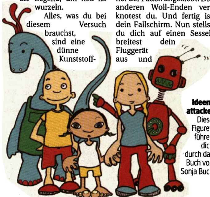
AUS: IDEENATTACKE! / JULIA KLÄRING / ZIT

Diese Figuren führen dich durch das Buch von Sonja Buch