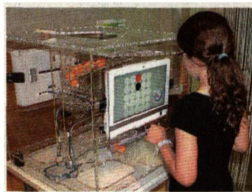
Modell: So funktioniert ein Faxgerät

! Das Science-Center-Netzwerk lässt dich erfahren, wie ein Faxgerät funktioniert (hat). In einem Raum berührst du Punkte, dadurch werden Tischtennisbälle angeschubst, die lösen einen digitalen Impuls aus – über Aus- und Einschalten, sozusagen mit 0 und 1, dem Grundprinzip des Computers. Dieser kommt in einem zweiten Raum auf einer baugleichen Maschine an. Dort werden wiederum Bälle in Bewegung gesetzt, die dort umkehrt jenes Muster entstehen lassen (sollen, wenn's funktioniert!), das du eingegeben hast. In einem Kanal kannst du selbst gebastelte Schiffe(rln) fahren lassen. Welchen Antrieb baust du?