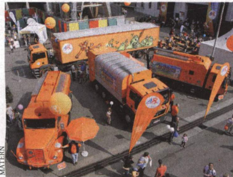
Alles orange beim Fest der MA 48 in Hernalers

maßnahmen und der Entminnungs- und Entschärfungsdienst in den gefährlichen Umgang mit alten und neuen Bomben. Auch die Beratung kommt am Tag der Bundespolizei nicht zu kurz: Beamte der Kriminalprävention geben einschlägige Tipps, und wer sich für