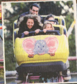
Die Zwillinge mit ihrer Betreuerin in der „Wilden Maus“.