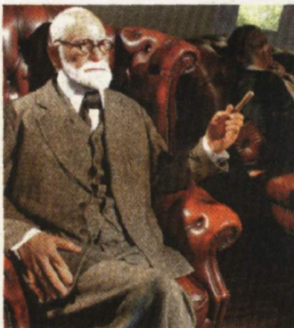
Darf als einer der Großen des Landes nicht fehlen: Sigmund Freud PRAMMER