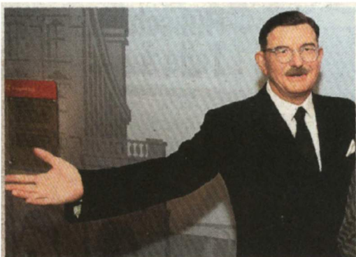
Der ehemalige Bundeskanzler Leopold Figl (1902 - 1965) ist einer von zahlreichen wächsernen Politikern