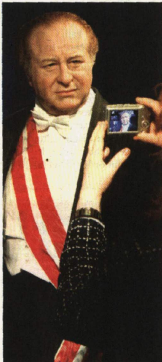
Ein Wiedersehen mit Kreisky ZAK