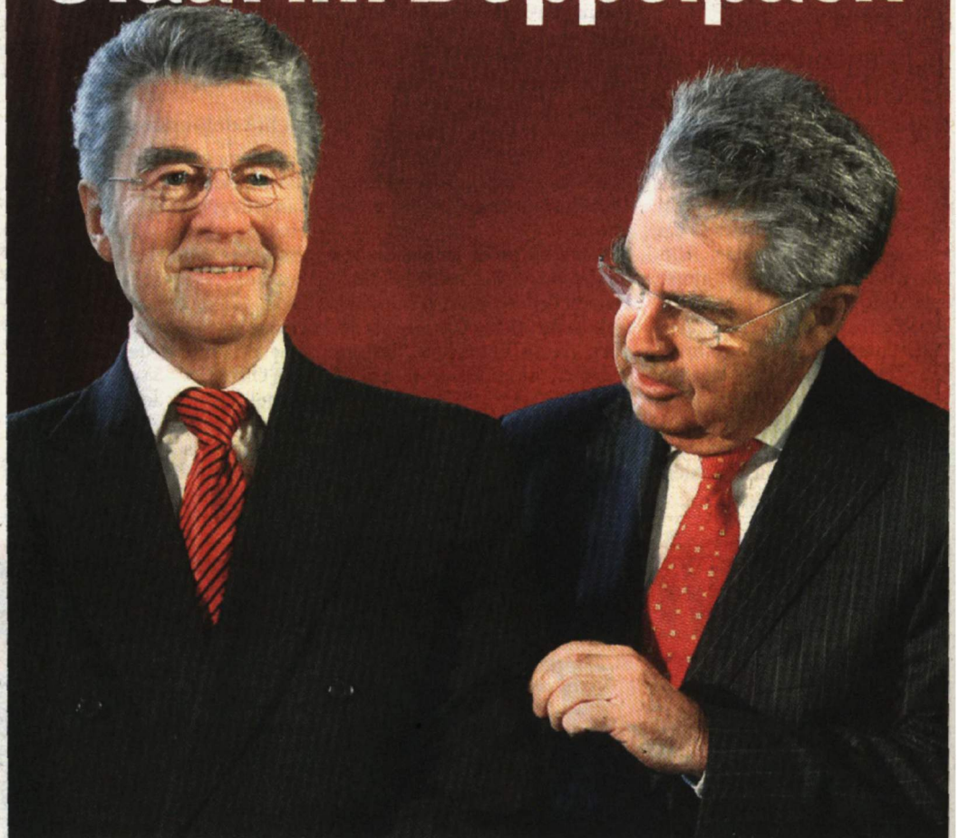
Anzug sitzt, Krawatte sitzt, Frisur passt auch, und der echte Bundespräsident Heinz Fischer ist sehr zufrieden