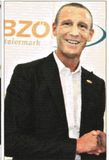
Das Lachen, die Ohren, die Frisur: Barack Obama (li.) und sein BZÖ-Doppelgänger