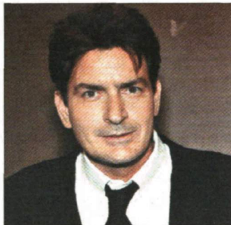
Superstar Falcos Figur (li.) sieht irgendwie aus wie der junge Charlie Sheen

Anfragen für weitere Nutzungsrechte an den Verlag Fotos: Tschlier, Archiv, picturedesk, AFP, Reuters