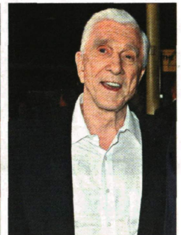
So sieht der Papst (li.) nicht wirklich aus – ist das Leslie Nielsen (†) in Soutane?