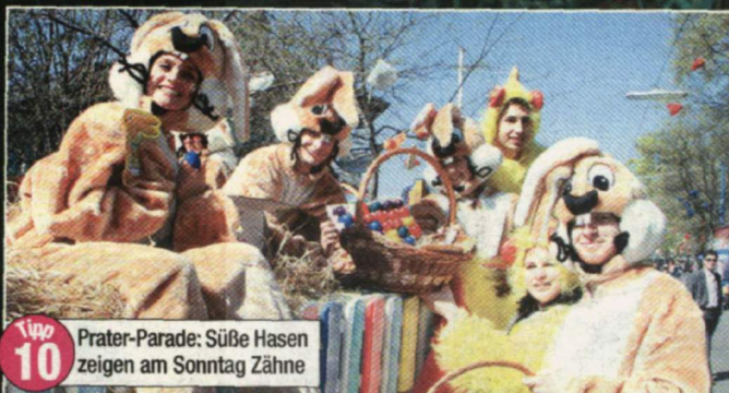
Tip 10 Prater-Parade: Süße Hasen zeigen am Sonntag Zähne

Tip 9 Nach dem falschen Hasen ein bisschen Sport: Das tolle Wetter bietet sich für eine ausgedehnte Tour auf dem Donauradweg an.