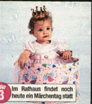
Tip 3 Im Rathaus findet noch heute ein Märchentag statt

Tip 4 Der Osterhase auf großer Donaufahrt: Am Sonntag wartet die MS Admiral Tegetthoff zum Brunch mit einer Zaubershow auf. Infos unter: www.ddsg-blue-danube.at