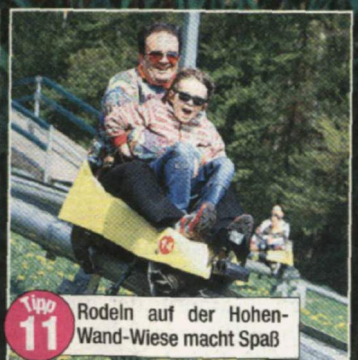
Tip 11 Rodeln auf der Hohenwand-Wiese macht Spaß

Anfragen für weitere Nutzungsrechte an den Verlag