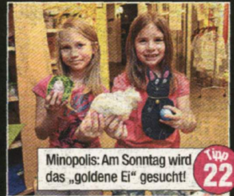
Tipp 22 Minopolis: Am Sonntag wird das „goldene Ei“ gesucht!

Tipp 21 Im Stephansdom wird um 9 Uhr (So) traditionell die Ostermesse gefeiert.