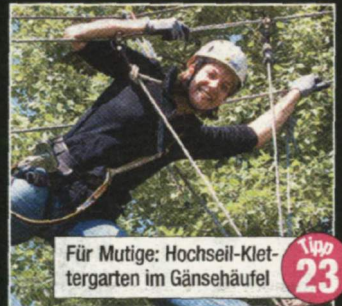
Tipp 23 Für Mutige: Hochseil-Klettergarten im Gänsehäufel