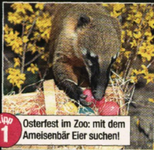
Tip 1 Osterfest im Zoo: mit dem Ameisenbär Eier suchen!

Ein Viertel aller Österreicher zieht es zu Ostern in die Ferne. Für die vielen Daheimgebliebenen hat „Heute“ die besten Tipps zusammengestellt, um das sonnige Wochenende mit 24 Grad am besten zu nutzen – viel Spaß und frohe Ostern!