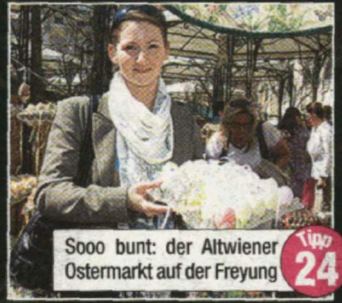
Tipp 24 Sooo bunt: der Altwiener Ostermarkt auf der Freyung

Tipp 12 Klassische Musik bieten die OsterKlang-Konzerte mit den Symphonikern. www.theater-wien.at