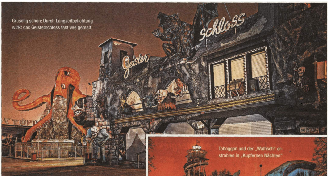
Gruselig schön: Durch Langzeitbelichtung wirkt das Geisterschloss fast wie gemalt