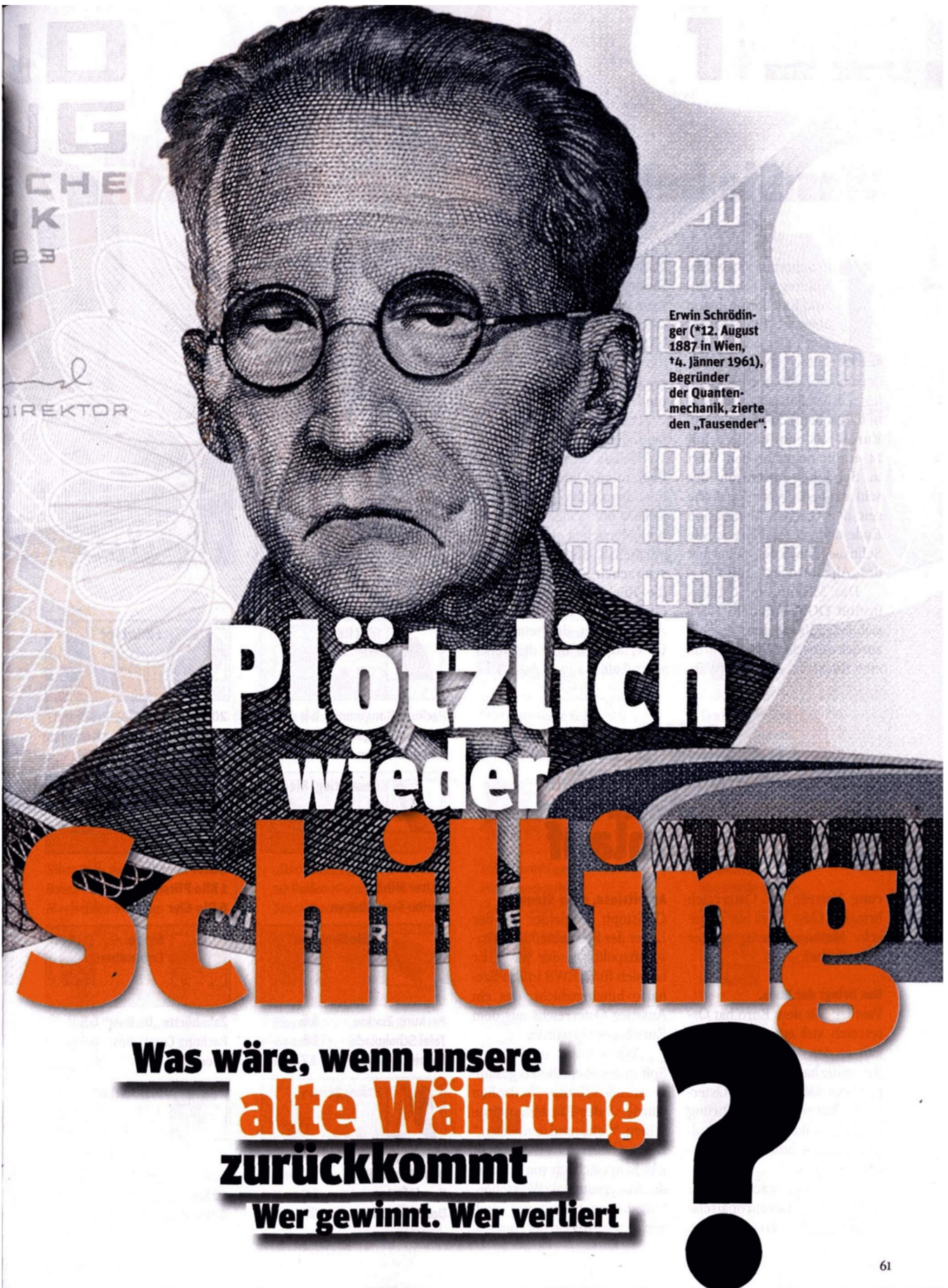
Erwin Schrödinger (*12. August 1887 in Wien, †4. Jänner 1961), Begründer der Quantenmechanik, zierte den „Tausender“.