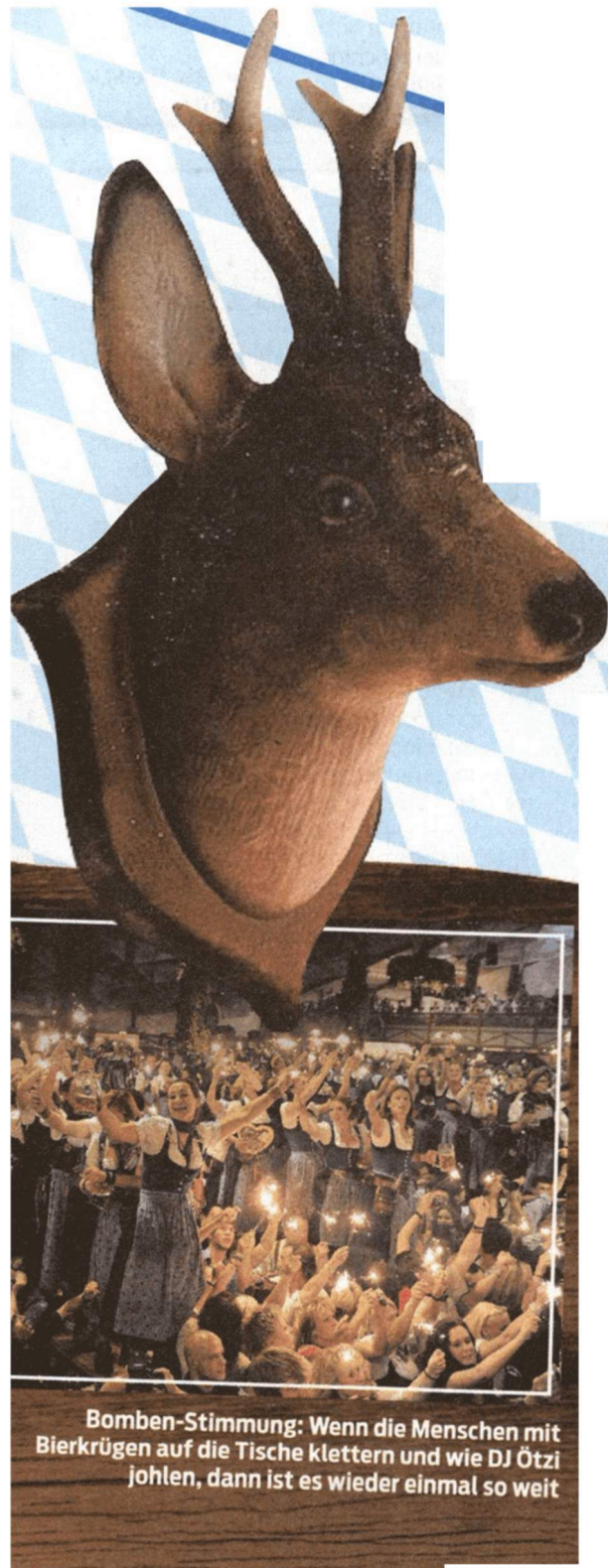
Bomben-Stimmung: Wenn die Menschen mit Bierkrügen auf die Tische klettern und wie DJ Ötzi johlen, dann ist es wieder einmal so weit