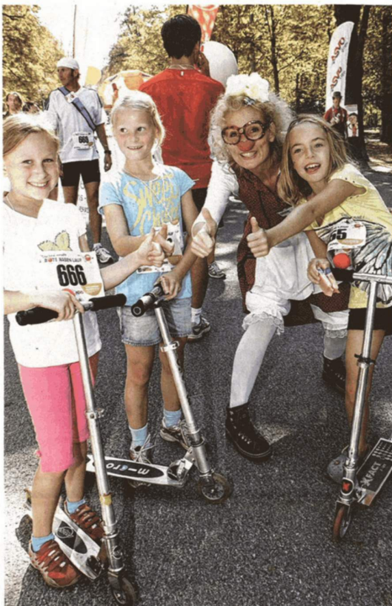
Der Spaß steht beim ROTE NASEN LAUF im Vordergrund

INFO UND ANMELDUNG ROTE NASEN LAUF Wien, Sonntag, 16. Sept. 2012, 9–15 Uhr, Start: Prater Hauptallee, Höhe Meiereistraße (Stadion), 1020 Wien; Anmeldung: Online bis heute, 14. Sept., 12 Uhr oder beim Lauf vor Ort; Startspende: Erw. 9 €, Kd. u. Jugendl. bis 18 J. 4 €, Fam. (ab 1 Kind) 18 €, Gruppen (ab 10 P.) 7 € p.P.; Infos und Anmeldung zu allen Läufen österreichweit unter: www.rotenasenlauf.at