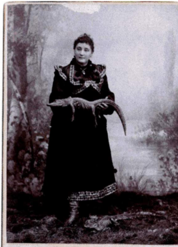
LÖWENBÄNDIGERIN MISS SENIDE