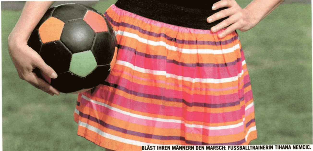
BLÄST IHREN MÄNNERN DEN MARSCH: FUSSBALLTRAINERIN TIHANA NEMCIC.

*Laut Statistik des Österreichischen Bundes-Sportfachverbands sind nur 5 % aller Trainer weiblich. Im Fußball gibt es keine einzige Trainerin.