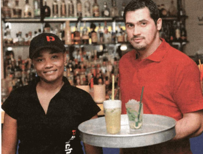
Im Pancho gibt's Cocktails, da hebts da die Schädeldecke ab! Zum Beispiel: Very Long Island Ice Tea.

Ist dir der normale Tequila zu langweilig? Wie wärs mit Agavenschnaps mit einem Wurm darin? Im „Pancho“ in der Blumauergasse 1A wird dir der „Mezcal“ genannte Schnaps mit einer Mottenraupe serviert. Der Legende nach wurde sie von Schwarzbrennern als Qualitätstest in den Schnaps gelegt, um die Trinkbarkeit zu überprüfen. Hat sie sich zersetzt, war der Schnaps ungenießbar. Neben dem Mezcal gibt es vielerlei Cocktails – und gleich zwei „Happy Hours“. Für die Unterlage wird echt mexikanisch aufgekocht – ob Tortillas (mexikanisches Fladenbrot) gefüllt mit pikantem Fleisch oder vegetarischer Salat. Tischreservierung am Wochenende unbedingt empfohlen!