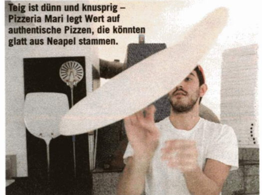
Teig ist dünn und knusprig – Pizzeria Mari legt Wert auf authentische Pizzen, die könnten glatt aus Neapel stammen.

Wenn man nach der besten Pizza in Wien fragt, lautet die Antwort überraschend oft: „Pizzeria Mari“. Die Original-Rezepte stammen aus Neapel. Den Teig der Pizza darf nur der älteste Pizzakoch mit der längsten Erfahrung mischen und das schmeckt man auch. Dann sind die jungen Teig-Schupfer dran. Die Zutaten für den Belag stammen direkt aus Italien, genauso wie die Pizzaköche. Dann ab damit in den – certo! – Holzofen. Nach einem Bissen spürt man schon die Leidenschaft, die Neapel ausmacht. Zu Mittag herrscht Hochbetrieb und auch abends empfehlen wir eine Reservierung.