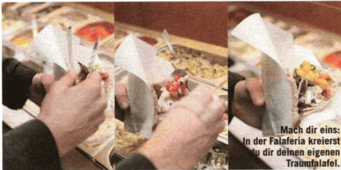
Mach dir eins: In der Falaferia kreierst du dir deinen eigenen Traumfalafel.