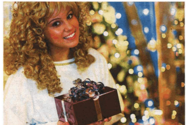
▲ Schenkfreudige „Christkindln“ finden auf den rund 20 Wiener Advent- und Weihnachtsmärkten Kunsthandwerk und Dekoideen.

Detail-Infos zu allen Weihnachts- und Adventmärkten: www.marktamt.wien.at