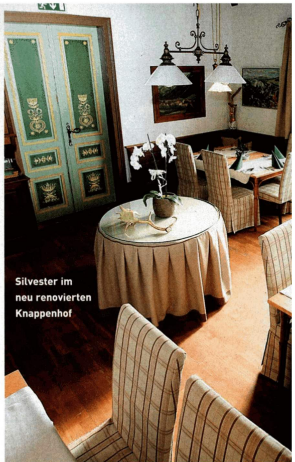
Silvester im neu renovierten Knappenhof