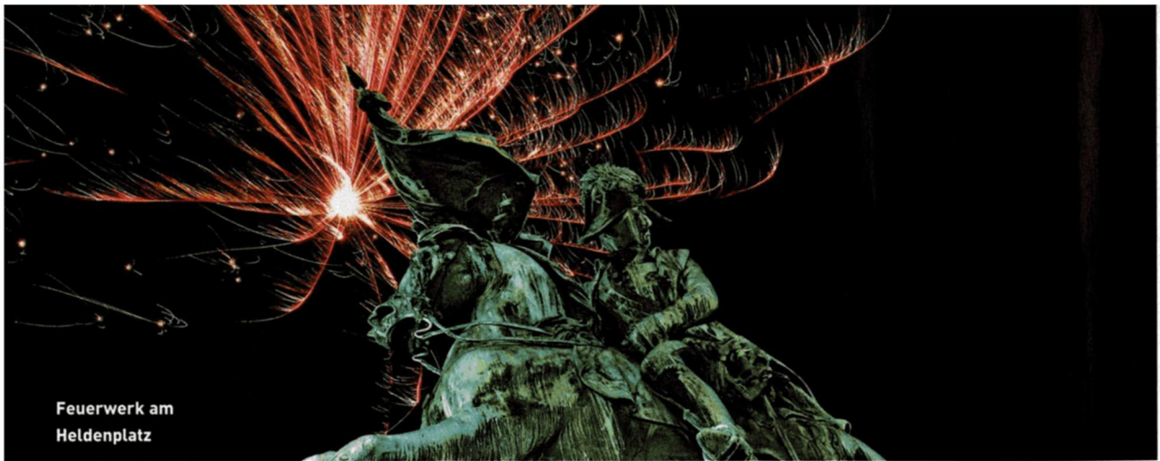
Feuerwerk am Heldenplatz