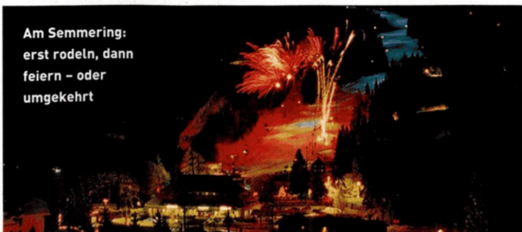
Am Semmering: erst rodeln, dann feiern – oder umgekehrt

BERGSILVESTER INNSBRUCK & SILVESTERNACHT MIT KLANG-FEUERWERK/ISCHGL. Silvesterfeier mit Musik von Abba bis Mozart vor der atemberaubend schönen Alpenkulisse, in Ischgl, Mathon (Ortsteil Nleder). Fest der Innsbrucker Nordkettenbahnen, Beginn: 18 Uhr. INFO: www.ischgl.com