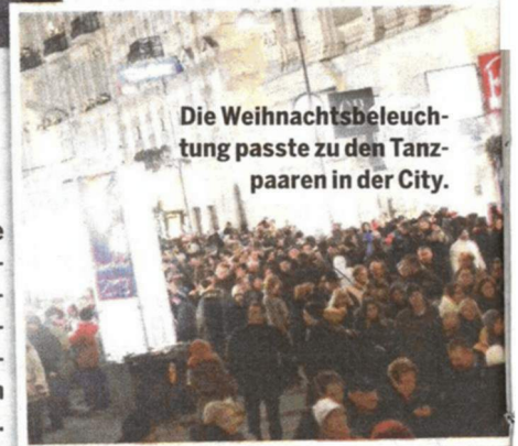
Die Weihnachtsbeleuchtung passte zu den Tanzpaaren in der City.

Der Graben wurde kurzerhand zum überdimensionalen Tanzparkett für Walzer-Freudige. Viele Wiener verkleideten sich mit bunten Masken.