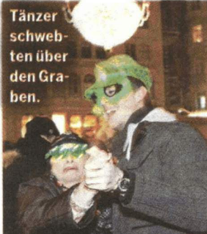
Tänzer schwebten über den Graben.

Auf dem Rathausplatz legte der Radio-Wien-DJ bis zwei Uhr Früh auf. Bei Sekt, Punsch und Bier herrschte Party-Stimmung vor dem hell beleuchteten Rathaus.