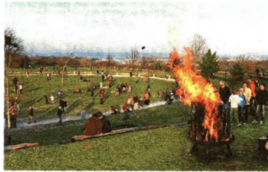
Um 18 Uhr wird am Samstag das Osterfeuer entzündet.

■ Eierspeis: Osterbrunch im Kunsthistorischen Museum.