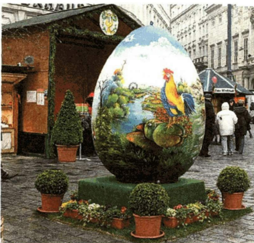
Freyung: Dieses Riesenei ziert den bunten Marktplatz.