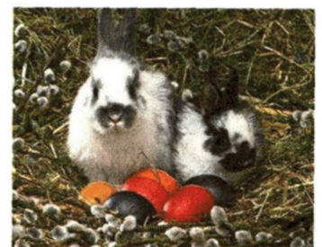
Auch die Tiere in Schönbrunn feiern.

Anfragen für weitere Nutzungsrechte an den Verlag