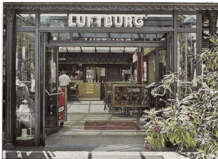
DABE! Die Luftburg, in der eine Steißenbreze wartet