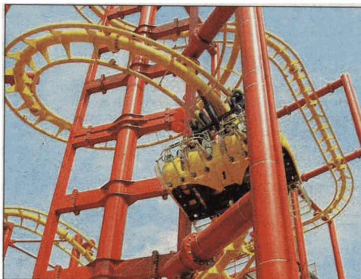
DABE! Volare - die liegende Position ist einzigartig