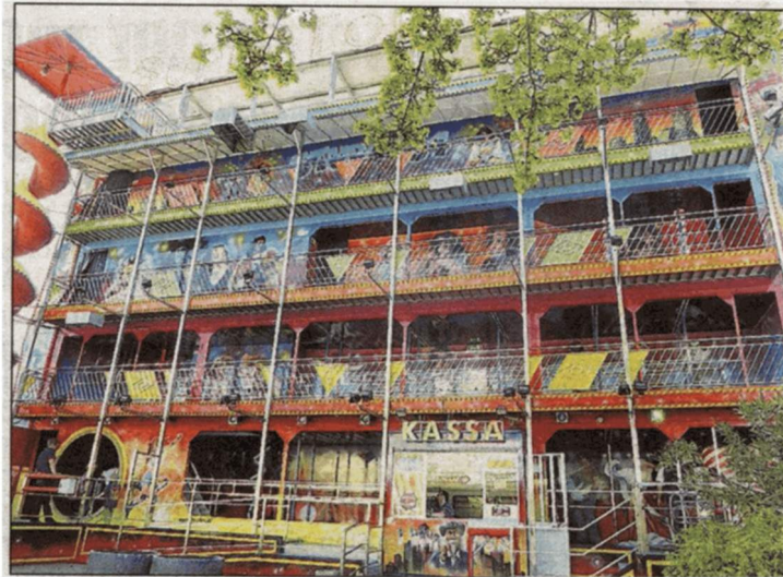
DABE! Super Top Dance, ein Haus voll Überraschungen