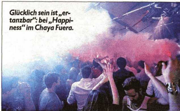
Glücklich sein ist „ertanzbar“: bei „Happiness“ im Chaya Fuera.