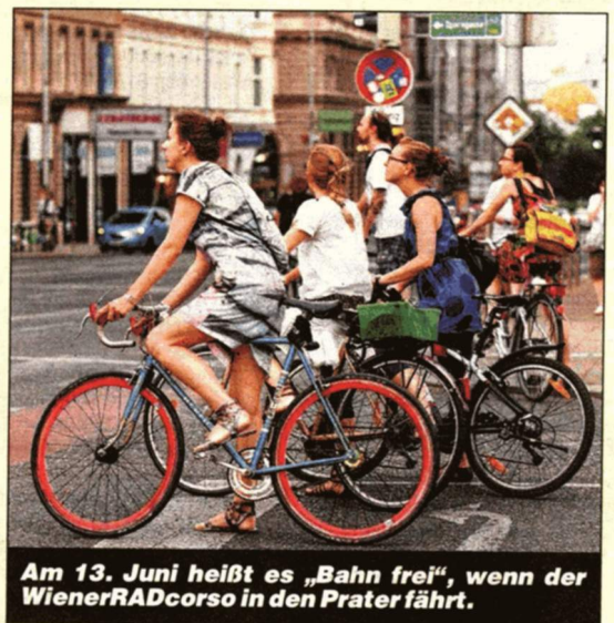
Am 13. Juni heißt es „Bahn frei“, wenn der WienerRADcorso in den Prater fährt.

Actiongeladen wird es am 15. und 16. Juni von 10 bis 18 Uhr auf dem Rathausplatz, wenn internationale Mannschaften beim Bike-Polo-Turnier um den Sieg kämpfen.