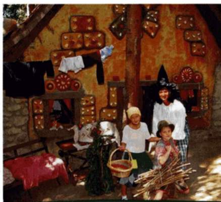
Freizeitpark Märchenwald Steiermark