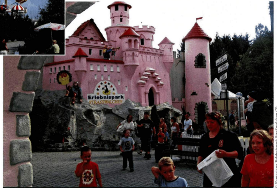
Erlebnispark Straßwalchen: Neue Attraktion um zwei Millionen Euro angekündigt