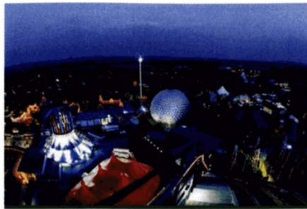
Europa-Park im deutschen Rust: Vier Millionen Besucher

Da der Wurstelprater nach dem sogenannten „Tivoli-Prinzip“ betrieben wird (benannt nach dem Freizeitpark in Kopenhagen), was nichts anderes bedeutet, als dass kein Eintritt verlangt wird, dafür aber die Benutzer bei jeder einzelnen „Attraktion“ zur Kasse gebeten werden, ist die