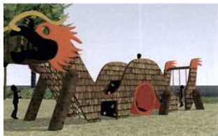
Bei der Konzeption noch ein sehr realitätsnaher Entwurf...

Wood'n'Fun: Konzeption und Umsetzung von individuellen Spielplatzkonzepten anhand des Beispiels Asia Spa Leoben (AUT)