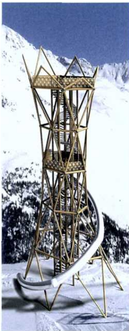
Wood'n'Fun Entwurf 30m hoher Aussichts- und Rutschenturm.

nend und aufregend sein soll, sondern sich auch bestmöglich in die Landschaft integrieren muss. Bei Rutschentürmen von Sunkid ist deswegen die naturbelassene Gebirgslärche das Material der Wahl.