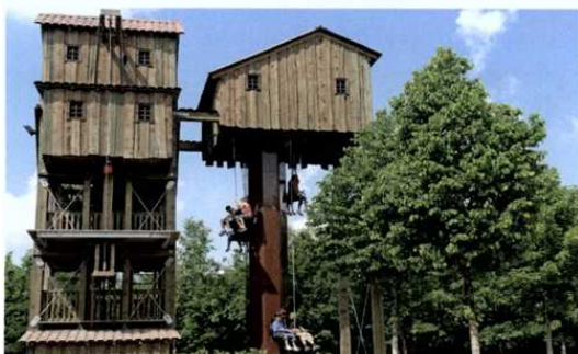
Der Sunkid Tower bietet zahlreiche Anwendungs- und Thematisierungsmöglichkeiten, wie hier am Beispiel Eifelrand in Gondorf (DEU) in Verbindung mit einem Holzkletterturm.

Individuelle Gestaltung ganz nach den Wünschen des Kunden Durch leichtes Ziehen am Seil wird eine Kletterbewegung simuliert, die eine motorische Hubbewegung der Doppelsitze nach oben bewirkt. Eine Attraktion, die nicht nur Kindern ab 4 Jahren, sondern auch Erwachsenen Spaß macht.