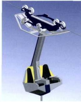
Der neue SKYDIVE XL überwindet eine Distanz von bis zu 150m und der Doppelsitz kann dabei per Hand beliebig gesteuert und um 360° gedreht werden