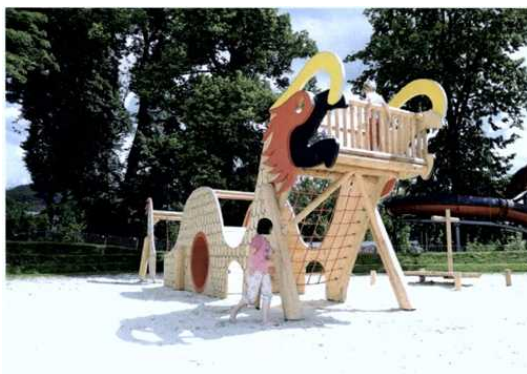
... und nur wenige Wochen später die perfekte Umsetzung

Das Lake Shirakaba Family Land, ca. 2,5 Autostunden von Tokyo (Japan) entfernt in der Präfektur Nagano gelegen, ließ sich für den Sunkid Tower ein phantasievolles Design mit Dach einfallen. Damit erinnert der Tower an einen der traditionellen überdimensionalen japanischen Schirme, die Wagasa genannt werden. Der interaktive Tower überzeugte den Kunden durch den geringen Platzbedarf (Stellfläche mit Durchmesser von nur 6 Metern) bei gleichzeitig hoher Kapazität (bis zu 320 Personen/Stunde).