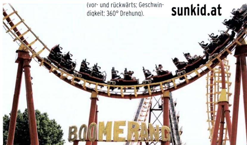
Im Bild die Achterbahn „Boomerang“ im Wiener Prater mit den neuen Zügen von Sunkid Amusement Technology.

durch eine exponierte Position, wie sie beispielsweise ein Aussichtsturm ermöglicht. Kann dieser Aussichtsturm dann zusätzlich noch bespielt werden vereint die Konstruktion mehrere Funktionen. Für Sunkid gilt die Devise, dass eine Attraktion nicht nur span-