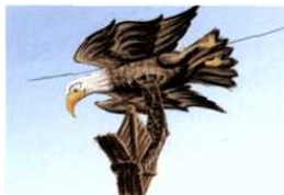
Auch beim Skydive XL sind kundenspezifische individuelle Gestaltungen möglich.

Als Weiterentwicklung des bisher bekannten SKYDIVE präsentierte Sunkid auf der INTERALPINA 2013 die Weltneuheit SKYDIVE XL dem interessierten Fachpublikum. Der große Unterschied zum