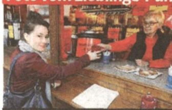
Die Wiener lieben den Punsch.

Foto vom Lieblings-Punschstand an wien@oe24.at