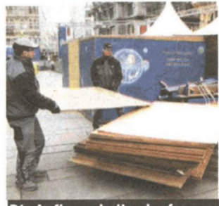
Die Aufbauarbeiten laufen.

kommen Kasperl, Freddys Freunde und Co. auf den