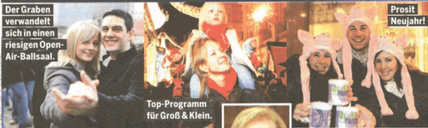
Der Graben verwandelt sich in einen riesigen Open-Air-Ballsaal.