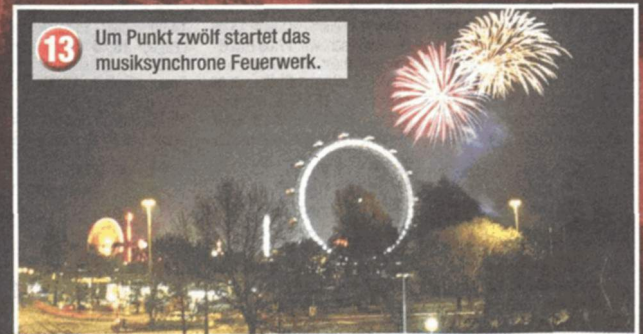
13 Um Punkt zwölf startet das musiksynchrones Feuerwerk.

10 Herbert-von-Karajan-Platz Ein absolutes Silvester-Highlight in Wien ist jährlich die Live-Übertragung von Johann Strauß' Operette „Die Fledermaus“