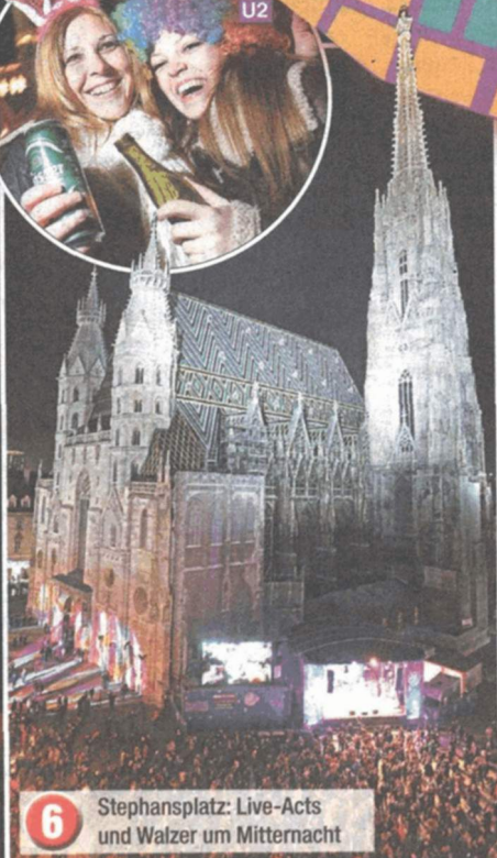
6 Stephansplatz: Live-Acts und Walzer um Mitternacht