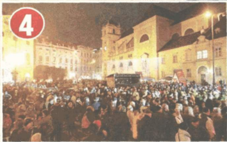
4 Freyung: Hier herrscht Live-Musik-Stimmung pur: Ab 15 Uhr Latino-Sounds von Los Gitanos, ab 19 Uhr Saubartl & ab 22.15 Uhr Die 3.