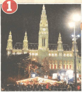
1 Rathausplatz: Hit-Feuerwerk – ab 17.15 Uhr AB-Original, ab 20 Uhr New Commitments, ab 22.15 Uhr Best of The Beatles & The Rolling Stones.