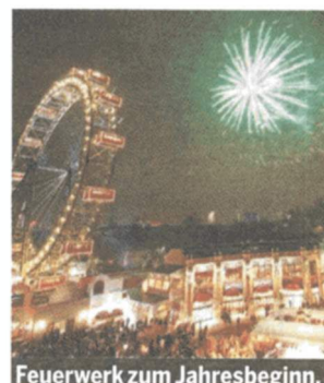
Feuerwerk zum Jahresbeginn.

Das Silvesterpfad-Programm auf den Seiten 20-21