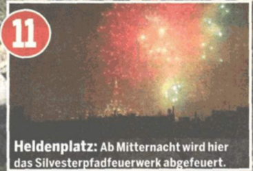
11 Herdenplatz: Ab Mitternacht wird hier das Silvesterpfadfeuerwerk abgefeuert.