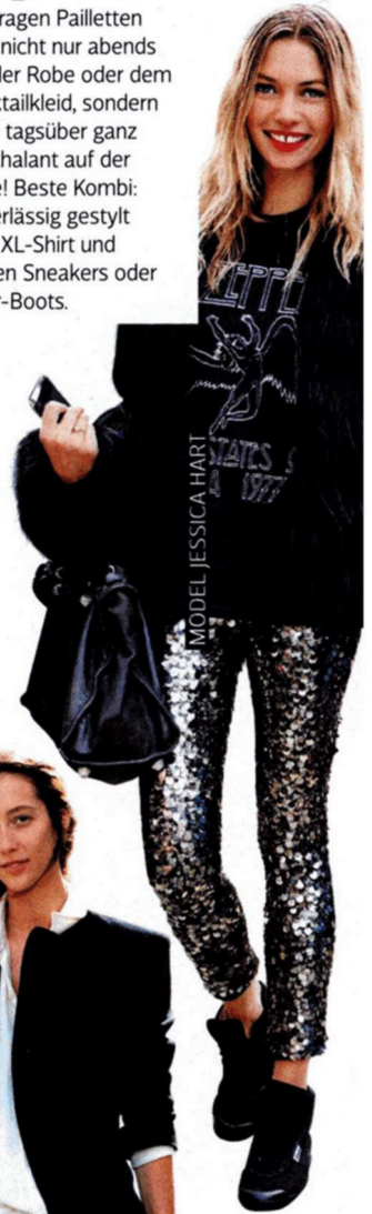
MODEL JESSICA HART

Wir tragen Pailletten jetzt nicht nur abends auf der Robe oder dem Cocktailkleid, sondern auch tagsüber ganz nonchalant auf der Hose! Beste Kombi: Superlässig gestylt zum XL-Shirt und coolen Sneakers oder Biker-Boots.