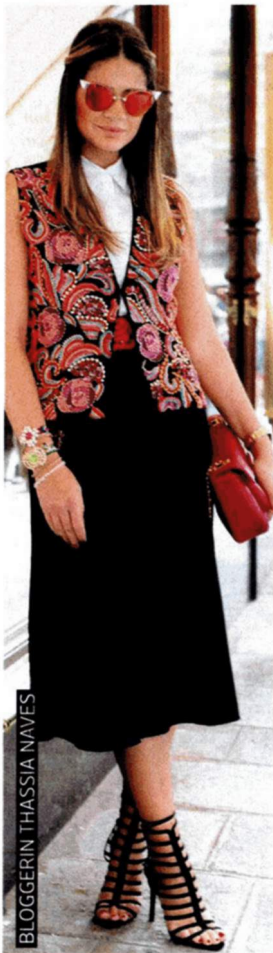
BLOGGERIN THASSIA NAVES