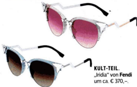
KULT-TEIL. „Iridia“ von Fendi um ca. € 370,-.