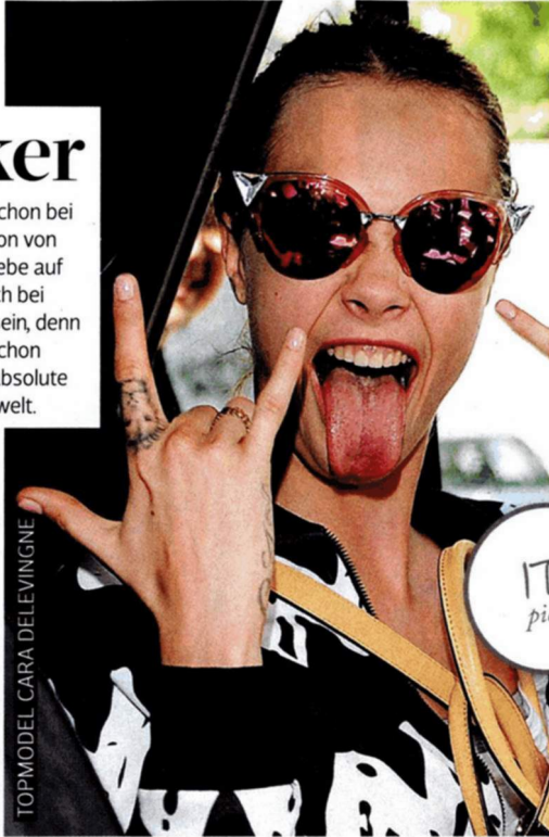
TOPMODEL CARA DELEVINGNE

Diese Sonnenbrille war für uns schon bei der Frühjahr-Sommerpräsentation von Fendi ein klassischer Fall von „Liebe auf den ersten Blick“. Das dürfte auch bei vielen Promis der Fall gewesen sein, denn die Fendi „Iridia“ entpuppt sich schon jetzt, im tiefsten Winter, als der absolute Accessoire-Liebling der Fashionwelt.