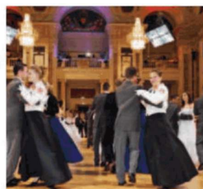
Traditionell: Heute tanzen die Offiziere in der Hofburg.

Ballsaison. Wien ist im Tanzfieber. Unzählige Blumen verbreiten heute beim Blumenball Frühlingsduft im Rathaus. Morgen wird beim Ball der Wiener Wirtschaft in der Hofburg getanzt. Wer lieber zu Techno als zu klassischer Musik das Tanzbein schwingt, ist am Samstag beim Technoball in der Pratersauna (2., Waldsteingartenstr. 135) gut aufgehoben.