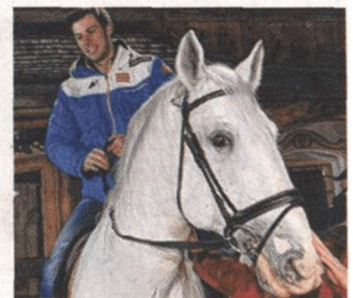
Pferdeliebhaber Mario Matt.