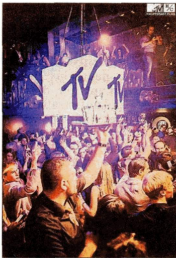
MTV Club am Freitag in der Box