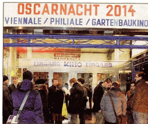
Das Gartenbaukino lädt zur Oscarnacht.

Auf www.krone.at gibt's einen Oscar-Live-Ticker.