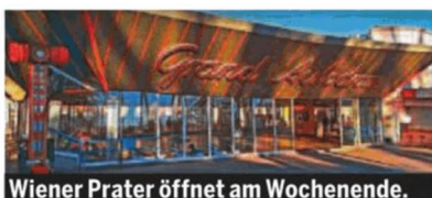
Wiener Prater öffnet am Wochenende.