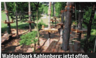
Waldseilpark Kahlenberg: jetzt offen.