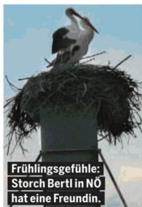
Frühlingsgefühle: Storch Bertli in NÖ hat eine Freundin.

Hoch »Guido« sorgt für 1 Woche Frühling Meteorologen versprechen: Am Wochenende bis zu 16 Grad und Sonne.