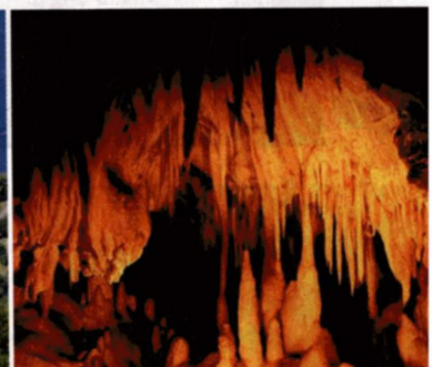
Stalagmiten, eine Grotte und ein See warten in der Obir Tropfsteinhöhle in Bad Eisenkappel auf Besucher