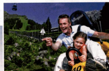
Auf der längsten alpinen Achterbahn – Tirol Alpine Coaster – geht's bergab