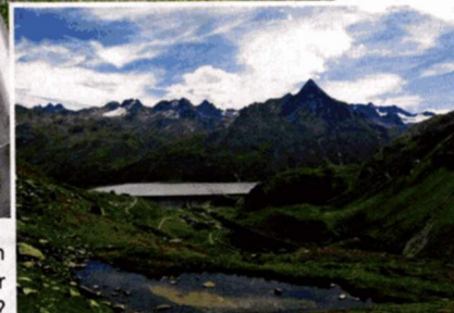
Oder wie wäre es mit einem Wandertag ausgehend von der Silvretta-Hochalpenstraße?