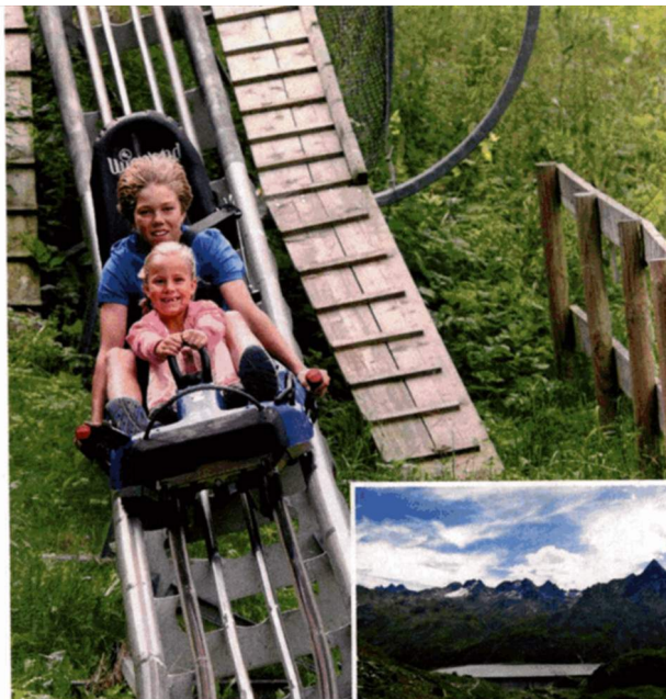
Das bringt Kinder zum Strahlen: Eine schnelle Fahrt mit dem Alpine-Coaster-Golm in Vorarlberg

In Wattens im Tiroler Inntal lädt die Kristallwelt Swarovski zur Entdeckung funkelnder Kunstwerke. Und im Sommer sorgt ein großer ▶