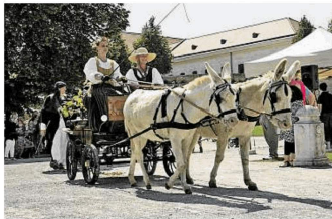
In Schloss Hof kann man romantische Kutschenfahrten unternehmen

Wer doch eine Runde mit dem Riesenrad drehen oder Zwergerlhochschaubahn fahren möchte, den erwartet im Prater ein umfangreiches Kinderprogramm sowie Sportvorführungen und Live-Konzerte. Zum Abschluss gibt es wieder das traditionelle Feuerwerk (22h).