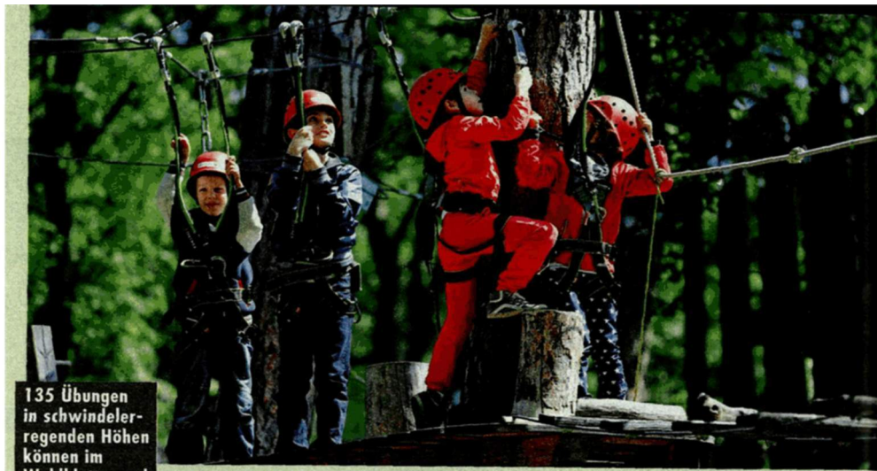
135 Übungen in schwindelerregenden Höhen können im Waldkletterpark Kahlenberg von mutigen Kids absolviert werden.