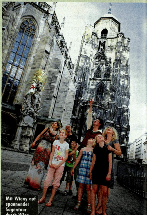
Mit Wien auf spannender Sagentour durch Wien – viele Szenen werden nachgestellt.