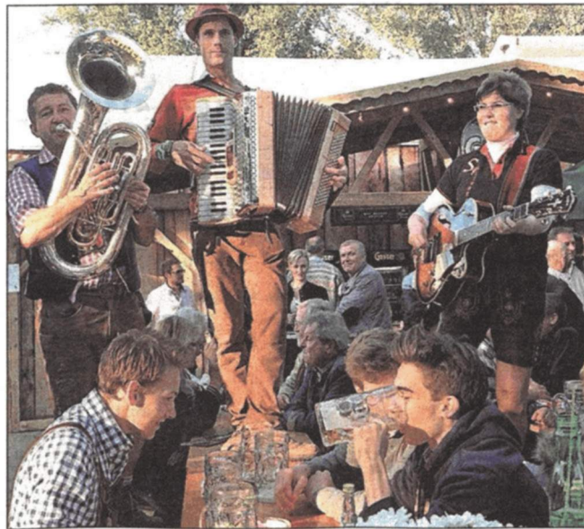
Zünftiges gibt beim Wiener Wiesn-Fest den Ton an