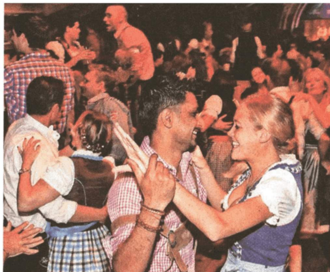
Zu Klassikern wie „Joana“ wird das Tanzbein geschwungen