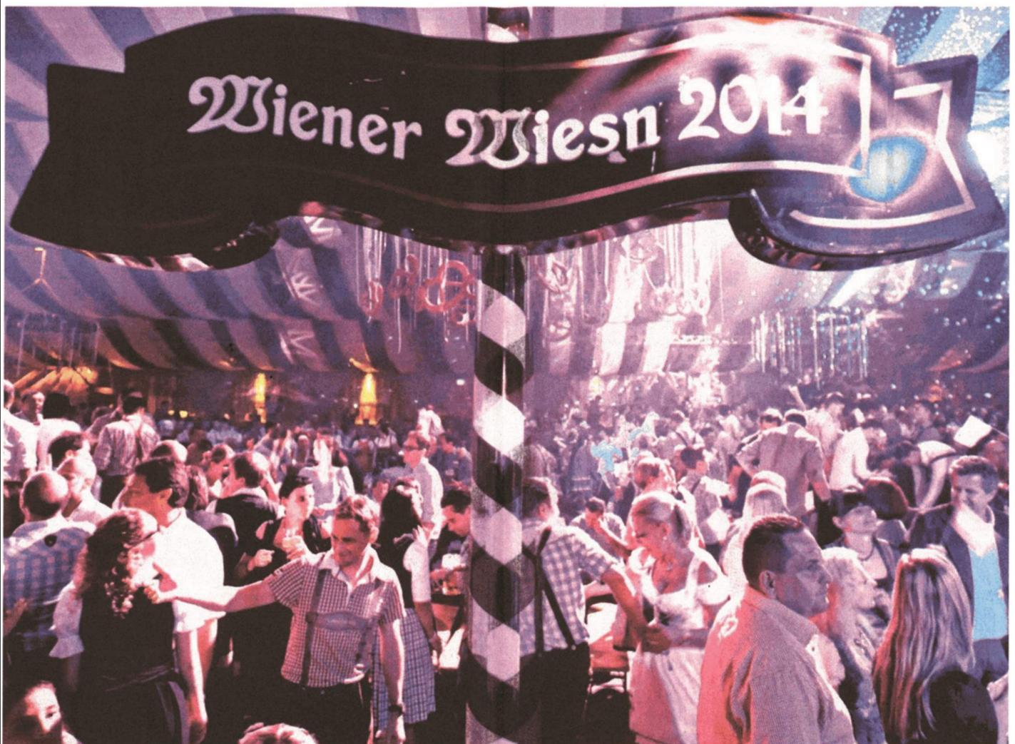
Die Festzelte sind gut besucht. 230.000 Besucher erwarten die Veranstalter heuer auf der Wiener Wiesn. Das Event findet noch bis 12. Oktober statt

Anfragen für weitere Nutzungsrechte an den Verlag