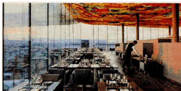
Acht ausgesuchte Top-Hotels im 4*- und 5*-Bereich werden im Winter zum Sonderpreis angeboten.