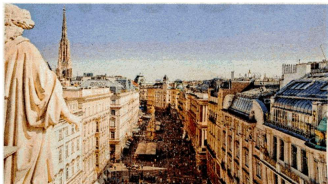
In Wien kann man dem Shopping-Herz freien Lauf lassen.