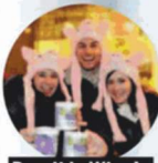
Prosit in Wien!