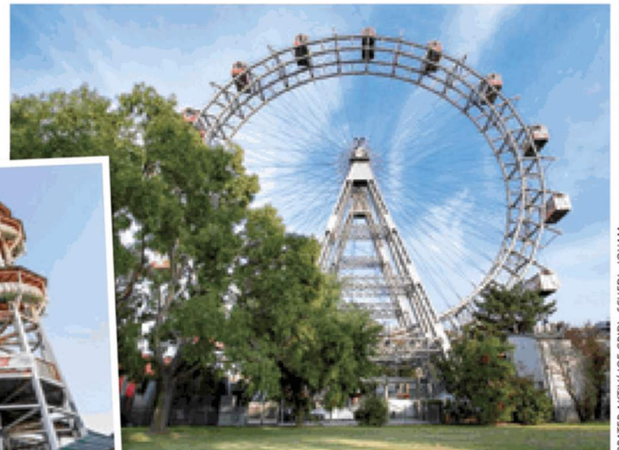
PRATER AKTIV/ JOE GRIDL, SCHEDL, JOHAM

Bei der Praterfee kann man sich beim Basteln und Malen mit den „lustigen Häschen“ austoben. Am Riesenradplatz gibt es von 14 bis 20 Uhr Livemusik. Und am Würstelplatz wartet ein „Hoppel-