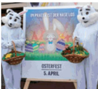
OSTERFEST | Die Osterhasen verteilen kleine Überraschungen

hopp“ im Original Wiener Kasperltheater.