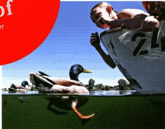
So ein Quak! Tag der Artenvielfalt am 6.6. entlang der Alten Donau.

Prater-Tage Ein Nachmittag im Prater mit der ganzen Familie: das kann ordentlich ins Geld gehen. Gut zu wissen daher, an welchen Tagen man billiger fährt. Der Klassiker ist natürlich der 1.5., ab 26.5. gibt es einen Familiendiensttag (bis zu minus 25%), weiters jeden Dienstag im Juli und August. Extra-Tipp 1: der Kinderflohmarkt am 13.9. Extra-Tipp 2: in der Praterfee finden jeweils am 1. Mittwoch im Monat Info-Veranstaltungen zu den Themen Geburt und Babybetreuung statt. www.prater.at , www.kolarik.at/babyfee