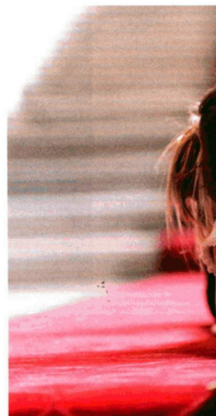
Beim Kinderlesefest im Rathaus werden 40.000 Bücher gratis verteilt.

Tag der Artenvielfalt Eine neue Zikaden- und 9 bis dato unbekannte Fledermausarten wurden beim Tag der Artenvielfalt 2014 entdeckt. Am 5.6. geht's abends los mit der Beobachtung nachtaktiver Tiere, am Tag darauf gibt es das volle Programm inklusive Mitmachaktionen für die Kinder. Am 6.6. an der Alten Donau. www.wien.gv.at/umweltschutz/naturschutz/biotop/vielfalt.html