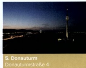
5. Donauturm Donauturmstraße 4

Der Wiener Wurstelprater ist eine Institution. Hier wartet Spaß für Jung und Alt. Ein Besuch im Schweizerhaus sollte in jedem Fall dazugehören.