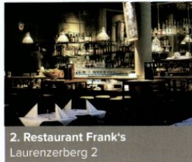
2. Restaurant Frank's Laurenzberg 2

Nähe Hauptbahnhof und auch nur wenige Minuten vom CCC entfernt. Bei der Buchung angeben, dass man CCC Gast ist und man bekommt Frühstück, Parkplatz und W-Lan gratis.