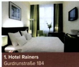
1. Hotel Rainers Gurdrunstraße 184

Wien, Linz, Salzburg, Kufstein, Innsbruck, Bregenz, Klagenfurt – das ist keine wahllose Aufzählung österreichischer Städte, sondern das sind jene Orte, an denen man einen Tag 1 der Concord Masters spielen kann. Das Konzept ist bewährt und erfolgreich – viele erste Starttage, in vielen Casinos der CCC-Gruppe, das Finale findet dann im CCC Simmering statt. Diesmal beträgt das Buy-in 300 Euro, die Garantiesumme unglaubliche 500.000 Euro, oder anders: eine halbe Million! Dieses Preisgeld verteilt sich auf die besten zehn Prozent im Teilnehmerfeld. Diese zehn Prozent spielen am 16. und 17. Mai das Finale. Der Mincash liegt allermindestens bei 1.000 Euro, davon werden 500 Euro in der jeweiligen Filiale sofort ausbezahlt, um z.B. als Reisekosten verwendet zu werden.