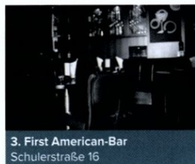
3. First American-Bar Schulerstraße 16

Meiner Meinung nach die besten Steaks in Wien! Habe mir sagen lassen, dass auch die fleischlosen Gerichte (Fisch, Pizza etc.) sehr gut sind, aber das werde ich wohl nie persönlich überprüfen können.